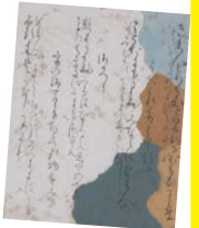
伊勢集断簡

料紙 (りょうし) とは、書きものをするための紙のことです。 奈良・平安時代には、詩歌 (ししか) を書くために、ごうかで美しく飾り立てられた料紙が用いられました。そのような紙を「装飾料紙 (そうしょくりょうし)」とよんでいます。それらの紙にはどんな技法が使われているのかな? みんなで装飾料紙づくりにチャレンジしながら、その美しい世界を体験しよう!