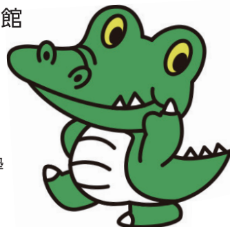
大阪大学 公式マスコットキャラクター 「ワニ博士」

大阪大学総合学術博物館 http://www.museum.osaka-u.ac.jp/